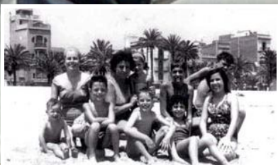
Grup d'amics del veïnat del carrer Caritat, durant l'any 1960.